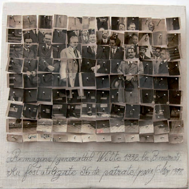
Reimagine, 1978, aiguilles de couture, bois, graphite (29 x 24 x 4 cm)

MANIFESTATION ORGANISÉE DANS LE CADRE DE LA SAISON FRANCE-ROUMANIE 2019