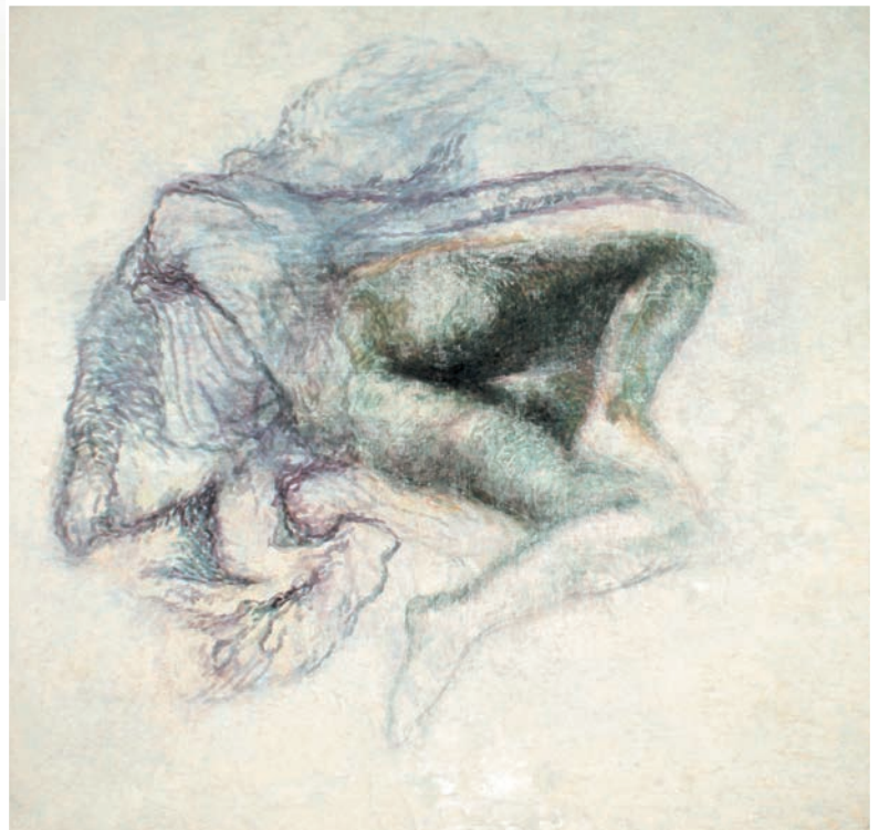
Féminin-masculin, 1982, pigments, huile de lin sur toile de lin (120 x 120 cm)

MANIFESTATION ORGANISÉE DANS LE CADRE DE LA SAISON FRANCE-ROUMANIE 2019