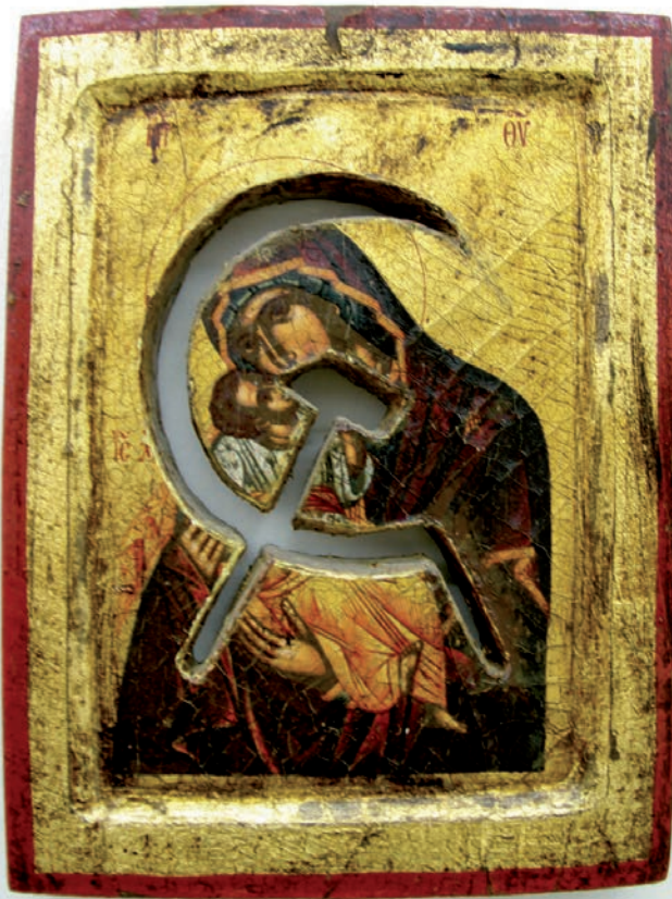
Communisme, 1995, icône byzantine dorure encaustique (12 x 12 cm)