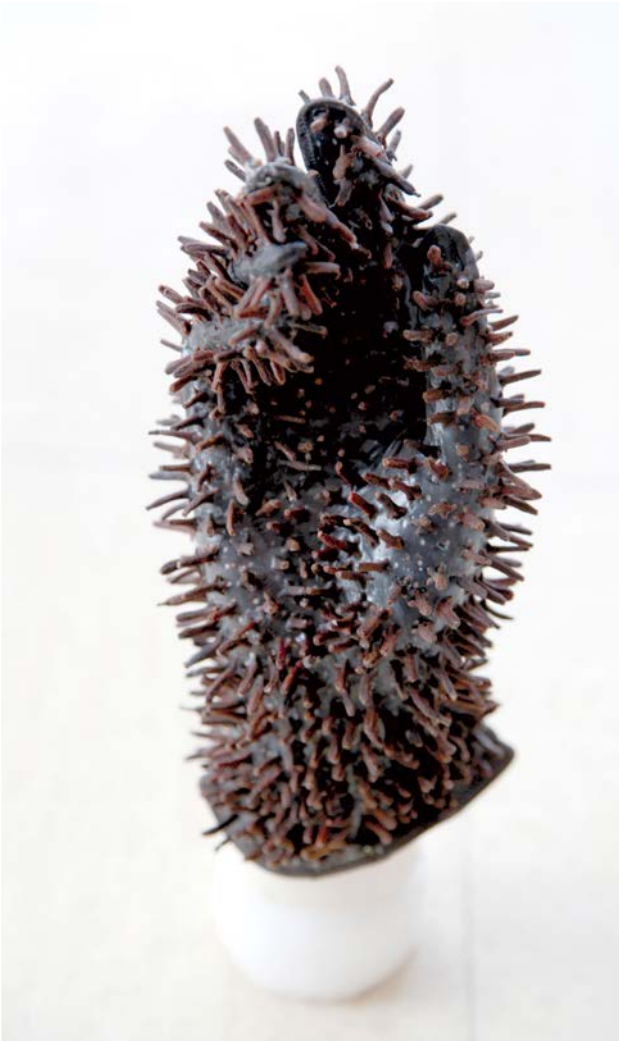
Gant bionique, 2012, gants en cuir, clous de girofle