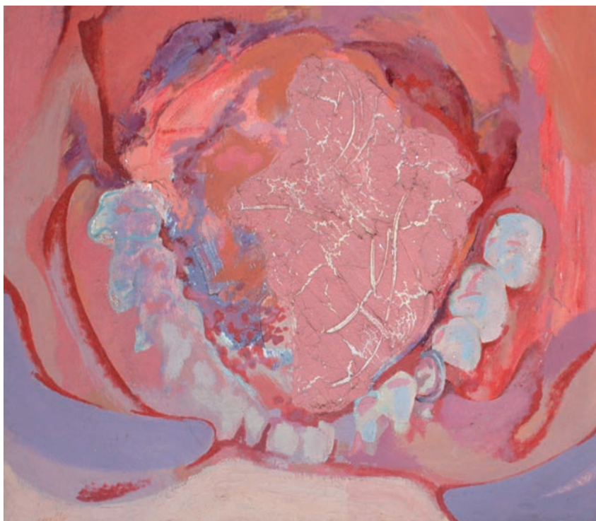
La bouche, 1978, huile sur toile (100 x 110 cm)